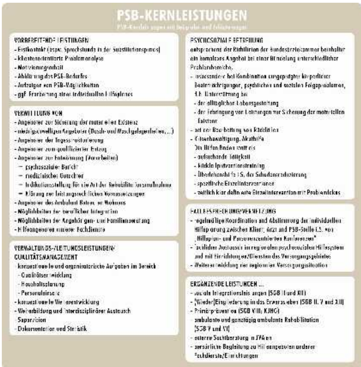
Schaubild: PSB-Kernleistungen (vgl. auch Schay 2006, Leitlinien psychosozialer Betreuung Drogenabhängiger; Bezirk Mittelfranken 2008, Leistungsbeschreibung PSB)