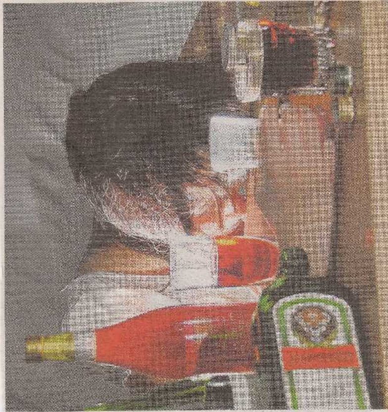
Wie man das Phänomen auch nennt – ob Rausch-Trinken oder Koma-Saufen –, auch die JKD verzeichnete im vergangenen Jahr zunehmend viele Alkoholexzesse.

Dennoch ist die JKD nicht glücklich mit der Reform. Im vergangenen Jahr habe sie viel Arbeitszeit getessen. Sichau: „Die Arbeit mit Süchtigen ist langfristig angelegt. Wir brauchen verlässliche Rahmenbedingungen. Doch die Kommunalisierung ist bis heute nicht abschließend geregelt.“ je