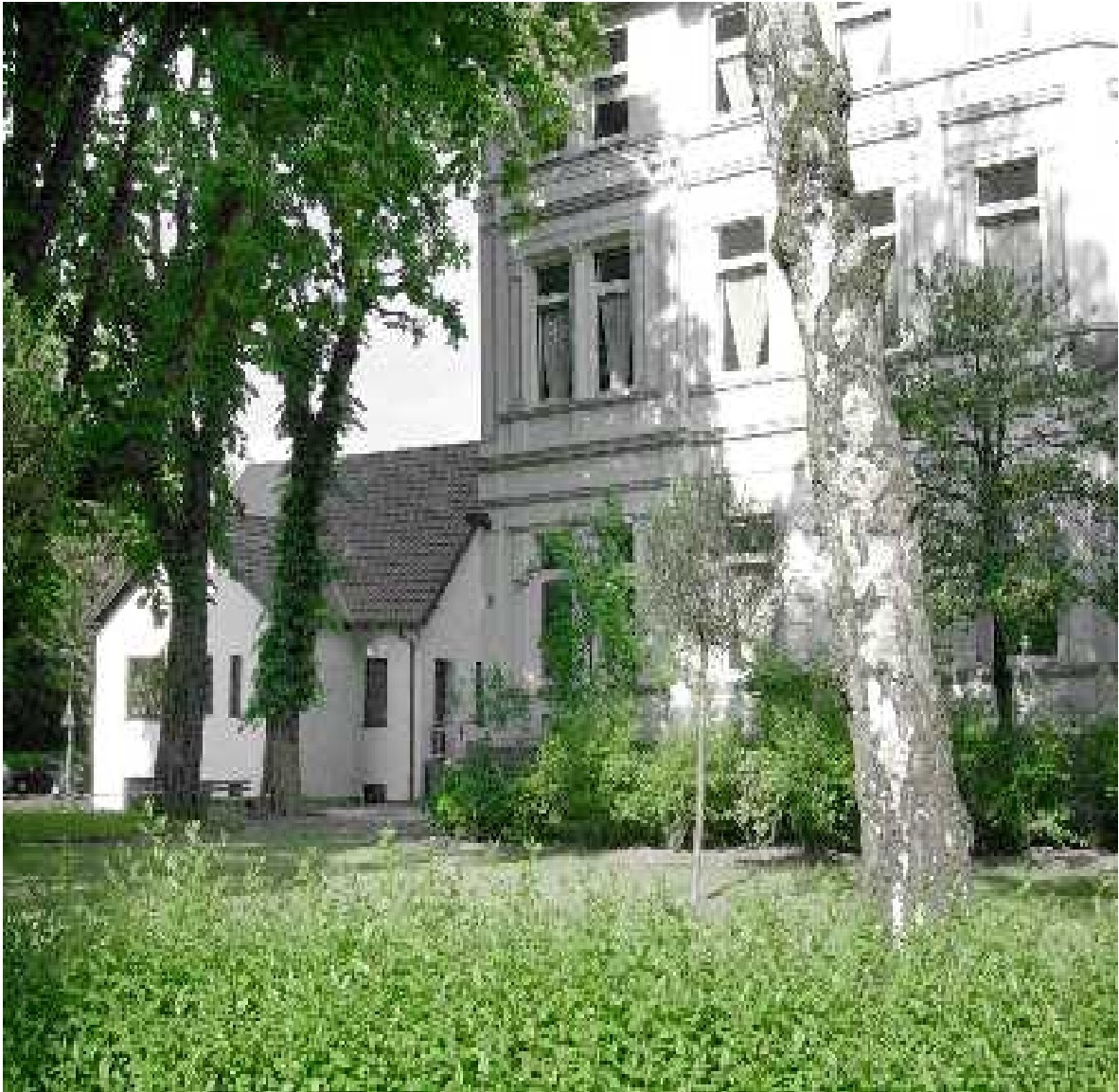
Bild: JKD - Psychosoziale Beratungsstelle, Hauptstraße 94, 44651 Herne