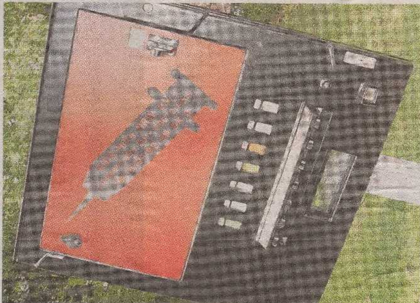
Der Spritzenautomat hinter dem Wanner Rathaus wurde nach anderthalb Jahren wieder aufgestellt.

„Treffpunkte“ gebe es indes ebenfalls in Herne, also auch Menschen, die sich regelmäßig der Infektionsgefahr aussetzen. Zwischen Januar und Dezember 2008 etwa suchten 67