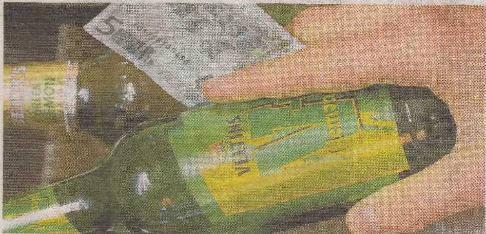
Alcopops, Biermischgetränke, hochprozentige Liköre. Jugendliche zeigen sich beim Komasaufen nicht wählerisch.